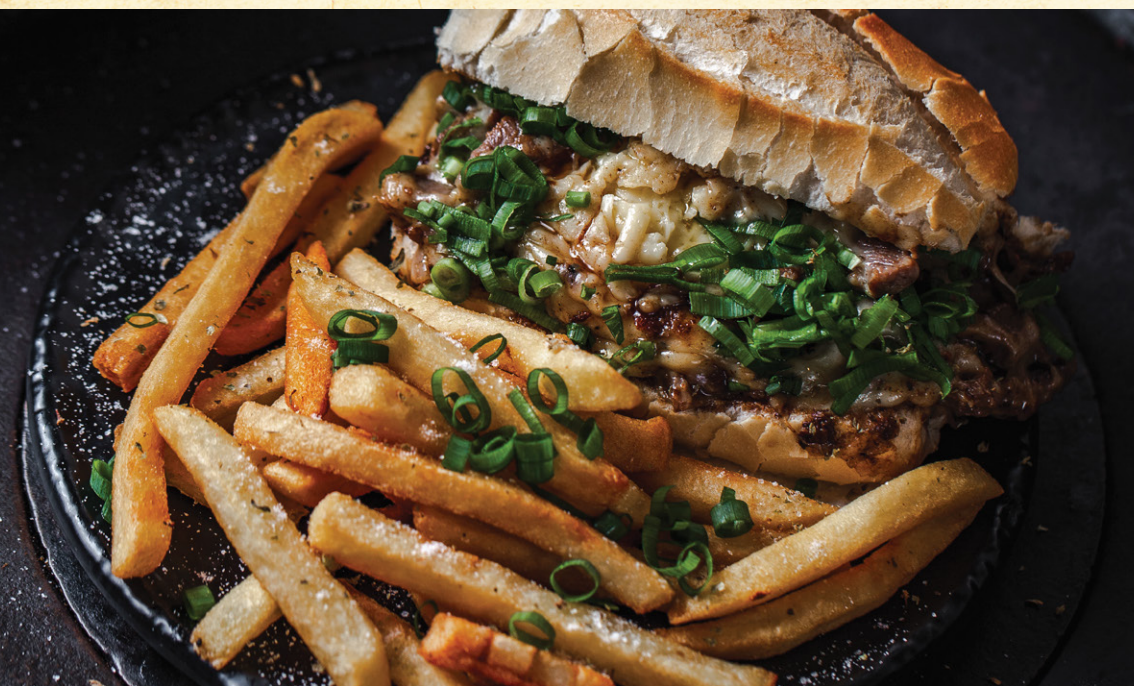
PÃO DE BÊBADO | 38 Miolo de alcatra ou frango, puxado na chapa com conhaque e cebola, servido no pão francês. Acompanha batata frita.