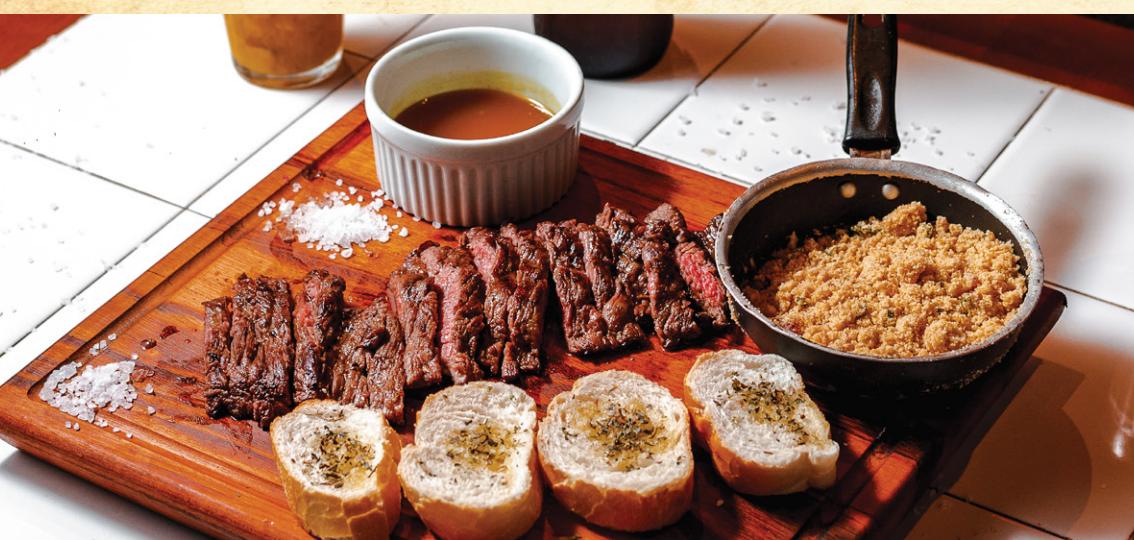
FRALDINHA NA MOSTARDA | 85 Molho de mostarda dijon e mel. Acompanha farofa e pão francês. - aprox. 350g