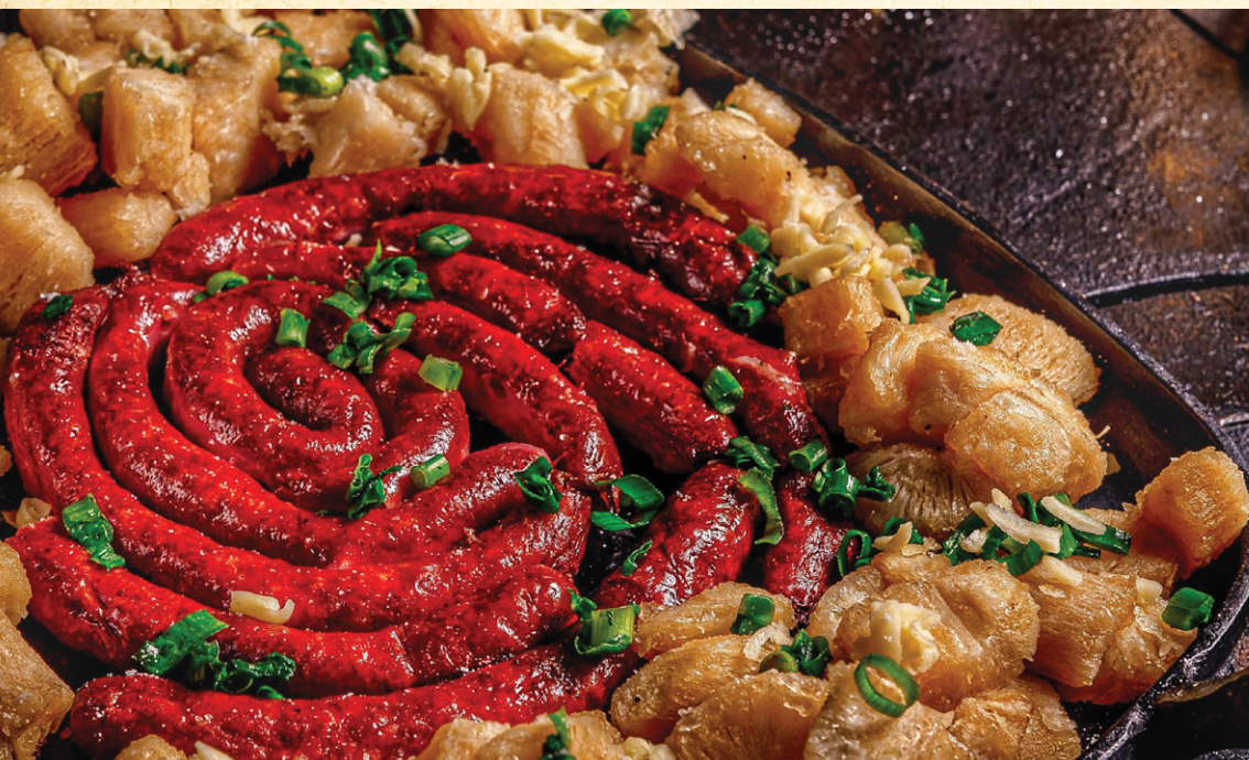
LINGUIÇA DE FRIGIDEIRA | 89 Linguiça artesanal servida na frigideira. Acompanha mandioca cozida