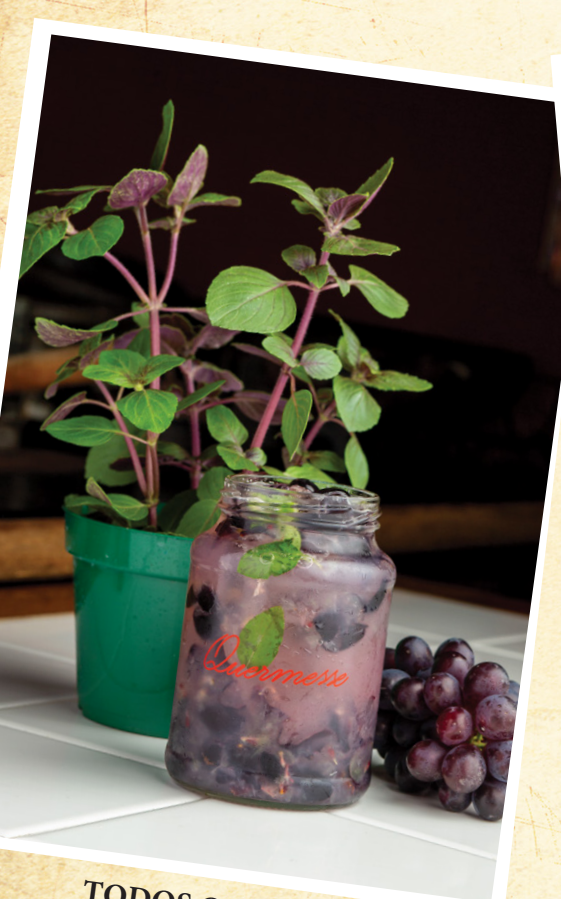
TODOS OS SANTOS