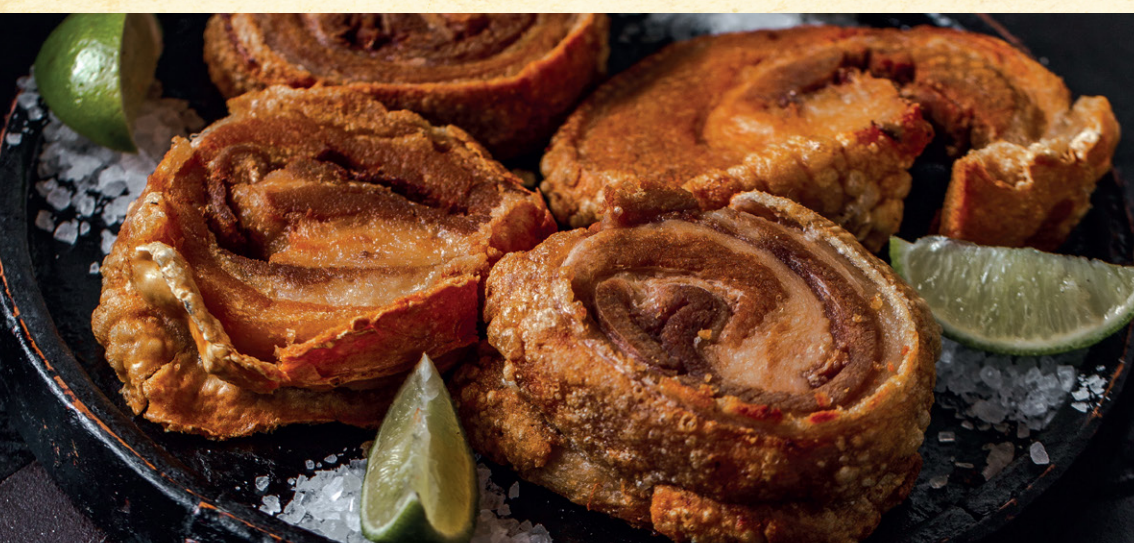
TORRESMO DE ROLO | 68 Panceta macia por dentro e crocante por fora. 3 rolos.