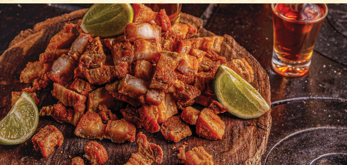
TORRESMO | 48 Torresmin em cubos do porquin servido com fatias de limão.