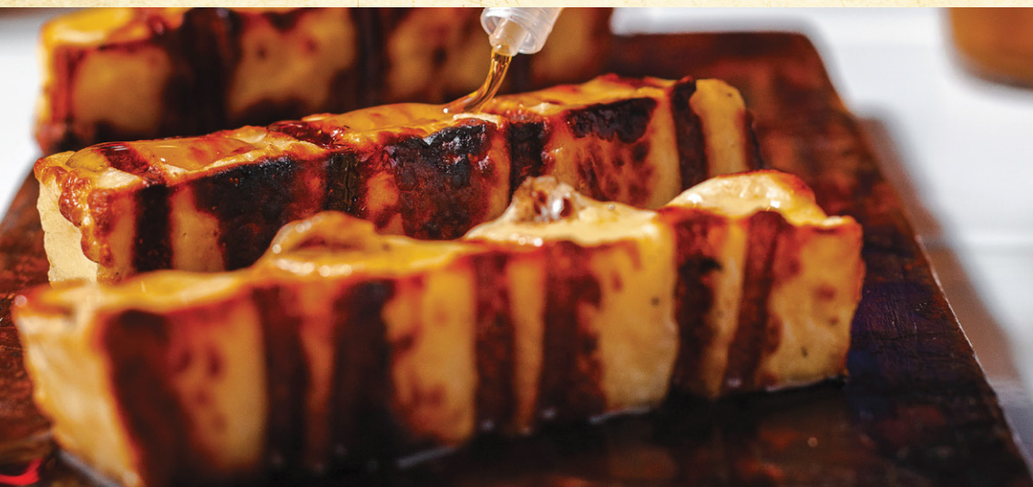
QUEIJO COALHO COM MEL DO OESTE | 36 3 unidades.