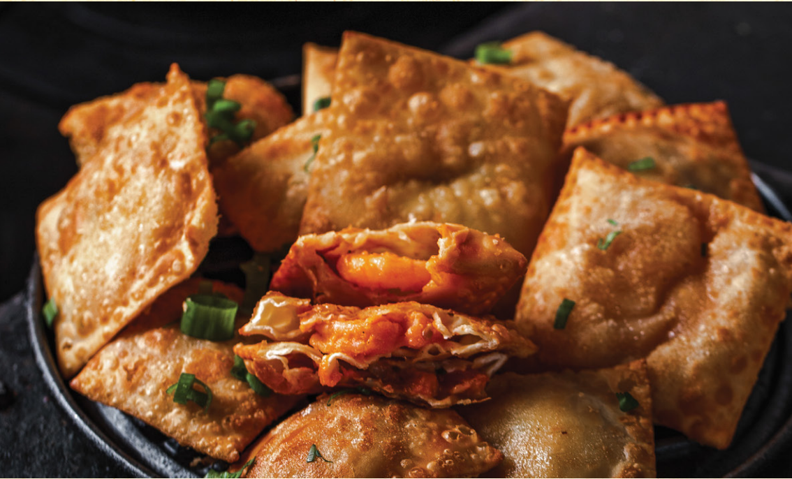
PASTELZINHO DE CAMARÃO DA PRAIA DO ROSA | 65 10 unidades de pastéis recheados com camarão e queijo catupiry.